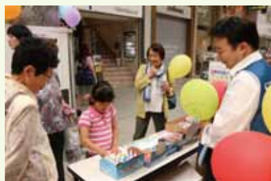
5/17-20 松山市大街道商店街

2014年11月に公益社団法人土木学会は創立100周年を迎えます。今年土木学会創立100周年を記念して、全国で地域と連携した様々な行事が行われています。「市民交流」を目的とする土木ふれあいフェスタも松山、広島、名古屋の3都市で開催されました。