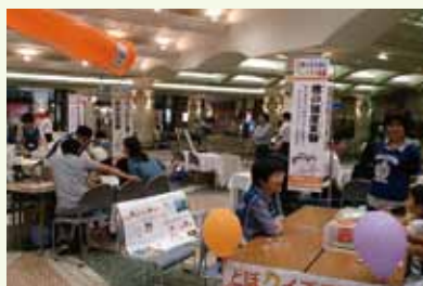
7/3-6 JR広島駅南口エールエール地下広場