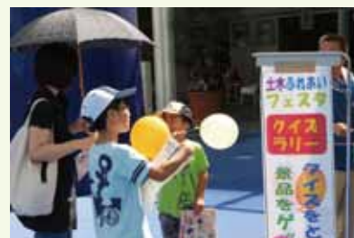
7/28-30 名古屋市オアシス 21 銀河の広場